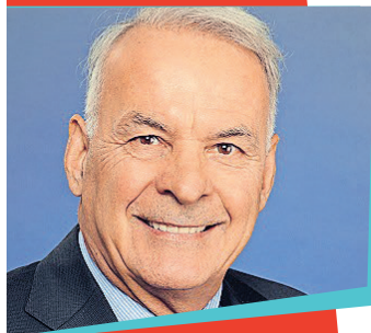
Alimentation Couche-Tard M. Alain Bouchard Fondateur et président